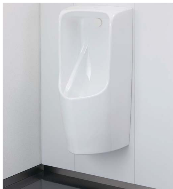
自動洗浄小便器(マイクロ波センサータイプ)