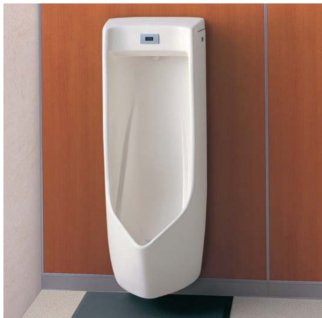
自動洗浄小便器(US一体型)